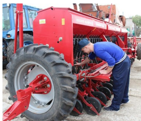
Тракторист-машиніст сільськогосподарсь- кого виробництва